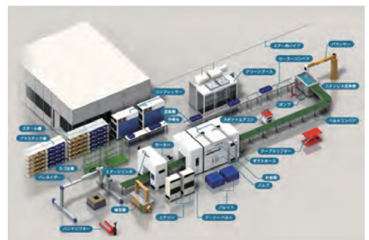
掲載例 製品の案内役を担います。