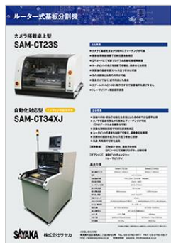
製品案内 表裏タイプ