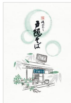
製品案内 イラスト表現