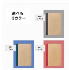
ブラック・ブルー・レッド