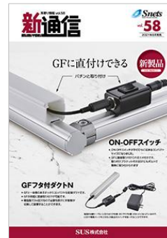
情報誌 新製品発売時発行

● お問い合わせ 株式会社アイツー 本社：tel: 054-266-5123 fax: 054-251-2808 mail: i2.sales-support@i2inc.co.jp