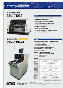
製品案内 表裏タイプ