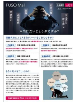
製品案内 表裏タイプ