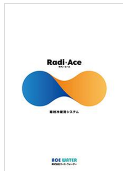
製品案内 冊子タイプ