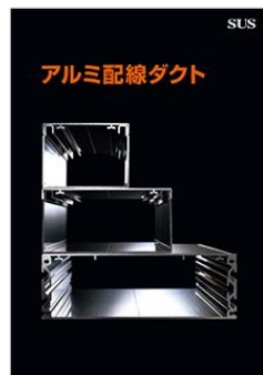
製品案内 冊子タイプ