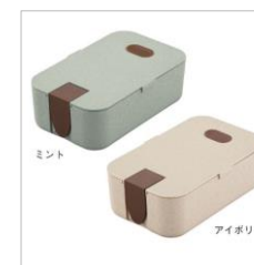
ミント・アイボリー

※商品向上を目的とし、お客様に断りなく仕様を変更させていただく場合がございます。