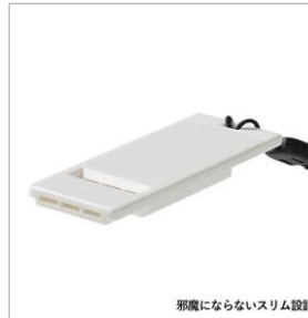
邪魔にならないスリム設計