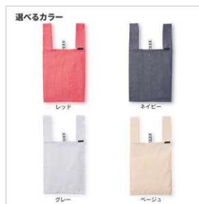
レッド・ネイビー・グレー・ベージュ